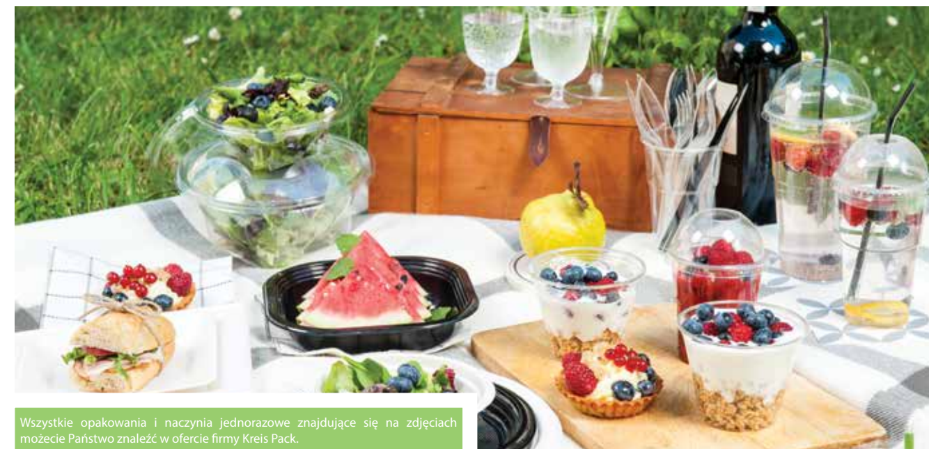
Wszystkie opakowania i naczynia jednorazowe znajdujące się na zdjęciach możecie Państwo znaleźć w ofercie firmy Kreis Pack.

Grillować można w zasadzie wszystko: mięsa i kielbasy, ryby, kaszankę i kurczaka, a nawet warzywa. Co kto lubi i co najważniejsze – jak lubi. Poniżej doskonały przepis na pstrąga z rusztu z leśnymi grzybami.